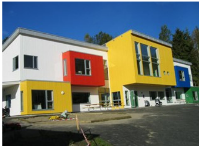
Siggerud gård barnehage